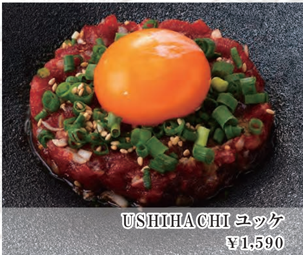
USHIHACHI ユッケ ¥1,590